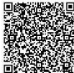
江戸川台駅東口階層式1階)

URL https://s-kantan.jp/city-nagareyama-chiba-u/offer/offerDetail/initDisplay.action?tempSeq=15329&accessFrom=