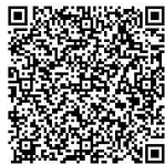
▲ネット申込み (運河駅東口第1)

URL: https://s-kantan.jp/city-nagareyama-chiba-u/offer/offerList_detail.action?tempSeq=15330