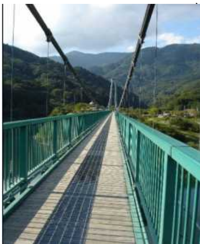
塩原もみじ谷大吊り橋(320m)

新年度も7月に入りましたが、会員親睦の行事を下表のように計画いたしました。今年度は、運動会を日曜日にいたしました。旅行は那須塩原方面で計画中です。