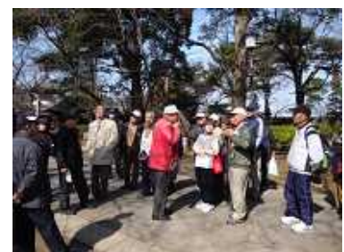
喜多院で川越SCの説明