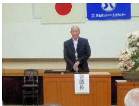
紅谷副会長開会宣言