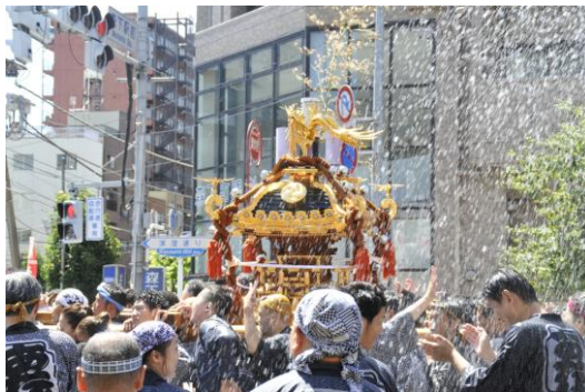
水花の神輿 川口美明 作品