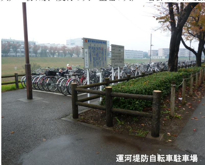
運河堤防自転車駐車場

利用者が乗って来て定められた駐車場に置いた自転車または原付自転車の整理・整頓、利用者からの相談、苦情処理、定期的な駐車場内外の清掃、駐車台数調査、放置自転車の取り扱い等を担当します。