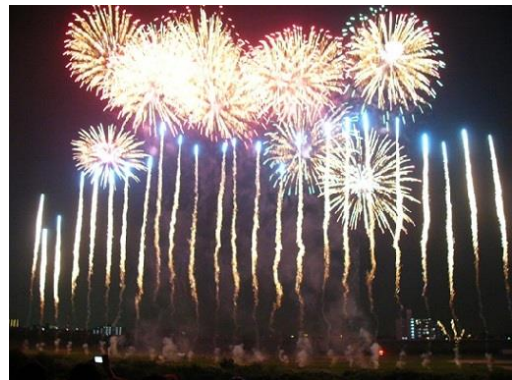
24年の流山の花火大会