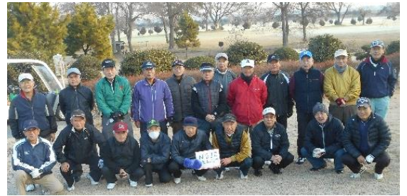
第47回コンペ 平成29年12月21日(木) 野田市PGひばりコース