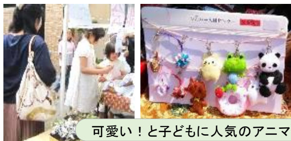
可愛い!と子どもに人気のアニマルストラップ