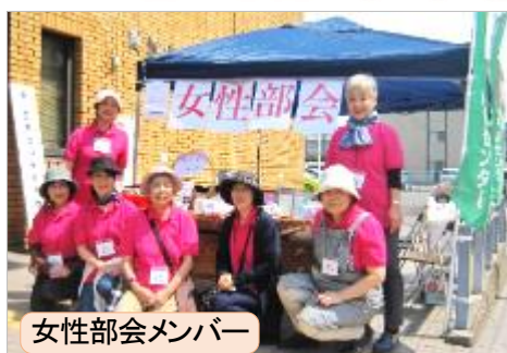
女性部会メンバー

5月11日(土)・12日(日)の両日に開催された「南流山センター&南流山福祉会館フェスタ」に、私たち女性部会は、手芸品・端切れ・花苗等の販売品および子ども向け「お絵かきせんべえ」200枚を用意してデビューしました。フェスタには多くの市民や親子連れが訪れて、私たちは慣れない経験であたふたと大変でしたが、準備した物をほぼ売り切る事ができ、幸先のよいスタートとなりました。