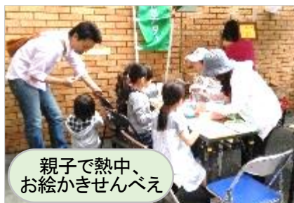
親子で熱中、お絵かきせんべえ