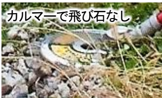
カルマーで飛び石なし

下花輪福祉会館で開催し、除草班・市民農園の新人を中心に9名が参加。本年度、刈払い機使用時に飛び石で車両等を損傷させた事故がすでに3件発生。その対策として、従来のチップソーからカルマーに変更して実施。カルマーは、上下2枚の刃が低速逆回転しバリカンで挟み込むように草を刈るため、小石