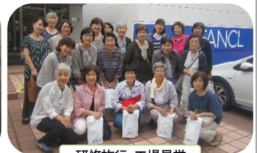
研修旅行-工場見学