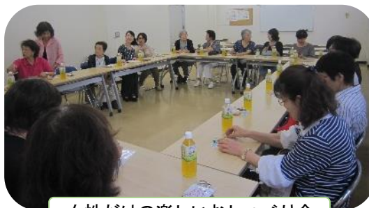
女性だけの楽しいおしゃべり会