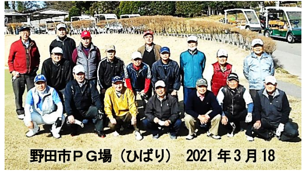
野田市PG場(ひばり) 2021年3月18