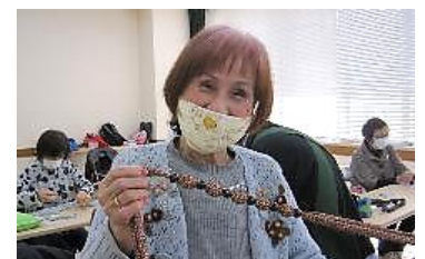
出来上がったネックレスで「ハイチーズ!!!」

南流山センターで開催され、12名もの多数が参加されました。当センター 伊藤職員よりセンターの仕組み・入会手続き等の説明、および平和台福祉会館 小高館長、木の図書館清掃 石田班長の女性就業事例発表が行なわれ、参加者は熱心に聞き入っていました。休憩後、ネクタイを再利用したネックレス作りが始まりました。参加者は、好みのネクタイ布・ビーズを選んで、真剣な顔つき・手つきで楽しく作業を終えました。女性部会員は、ネックレス作りをお手伝いしながら、センターのアピール・入会の勧誘もしっかりとしました。終了後のアンケートでは多くの参加者から、入会を考慮する、ネックレス作りは楽しかったとのコメントを頂きました。(倉野 美知子・記)