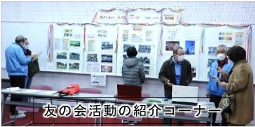
友の会活動の紹介コーナー

シルバーフェスタを盛り上げるため、シルバー友の会及び各同好会が参加し協力しました。