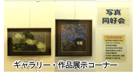
ギャラリー・作品展示コーナー

コロナ感染も終息に近づいて友の会活動の自粛も終り、4月以降、バス旅行・ウォーキング・パーティ等を計画しております。また会員・OBの皆さまと楽しい時間が過ごせることを楽しみにしています。 (横田清四郎・記)