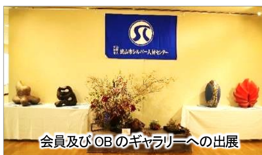
会員及びOBのギャラリーへの出展