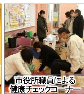
市役所職員による 健康チェックコーナー