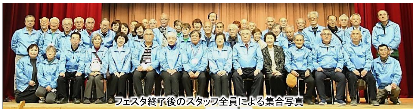
フェスタ終了後のスタッフ全員による集合写真