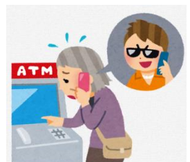
ATM注意！ 振り込め詐欺