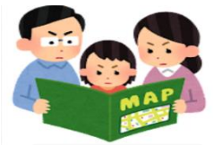
ハザードマップの確認